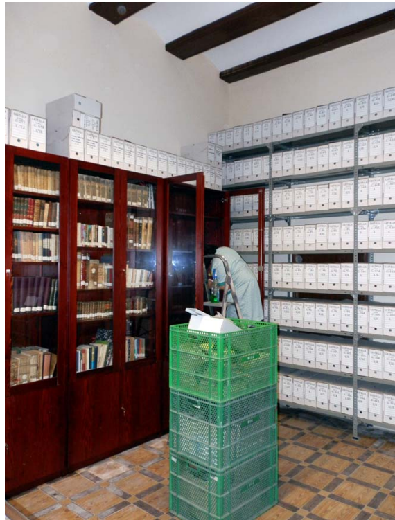
Làmina 2. Neteja de la secció història de l'Arxiu Municipal de Castalla situada a la casa de la família Rico.