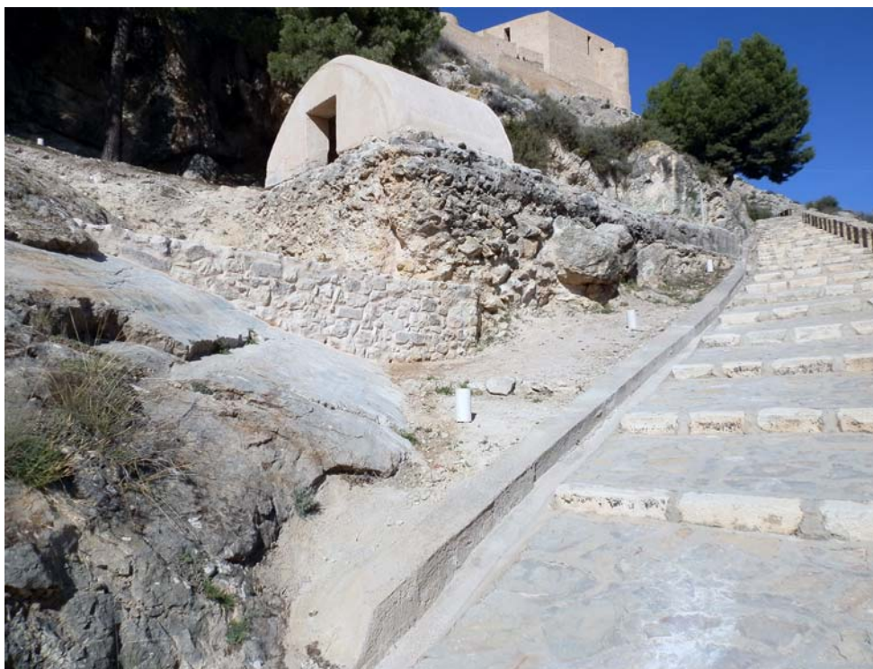
Làmines 15 i 16. Fites de delimitació de l'aljub i les estructures annexes.

La intervenció executada ha servit, en definitiva, per a recuperar l'aljub i integrar-lo dins del recorregut visitable del Conjunt Patrimonial del Castell de Castalla (làm. 17).