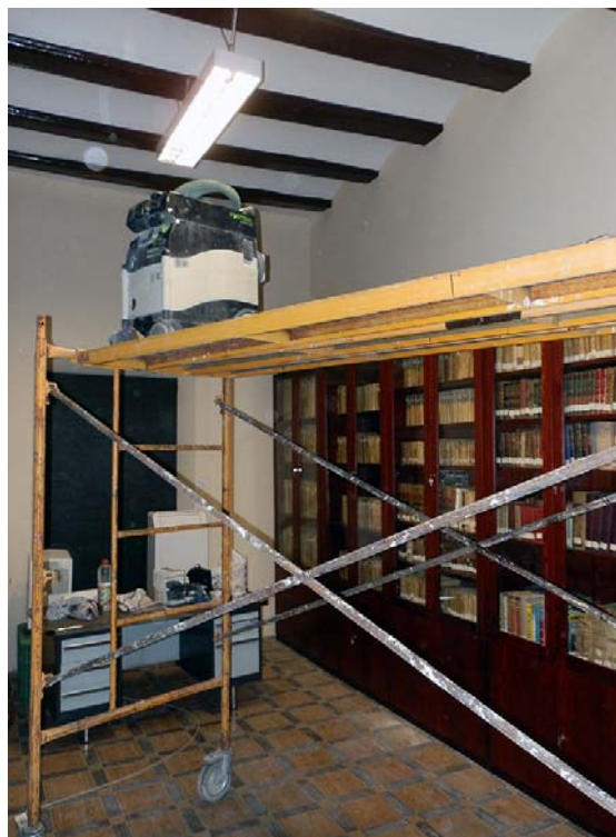
Làmina 3. Tractament de les bigues contra el corc de la fusta.