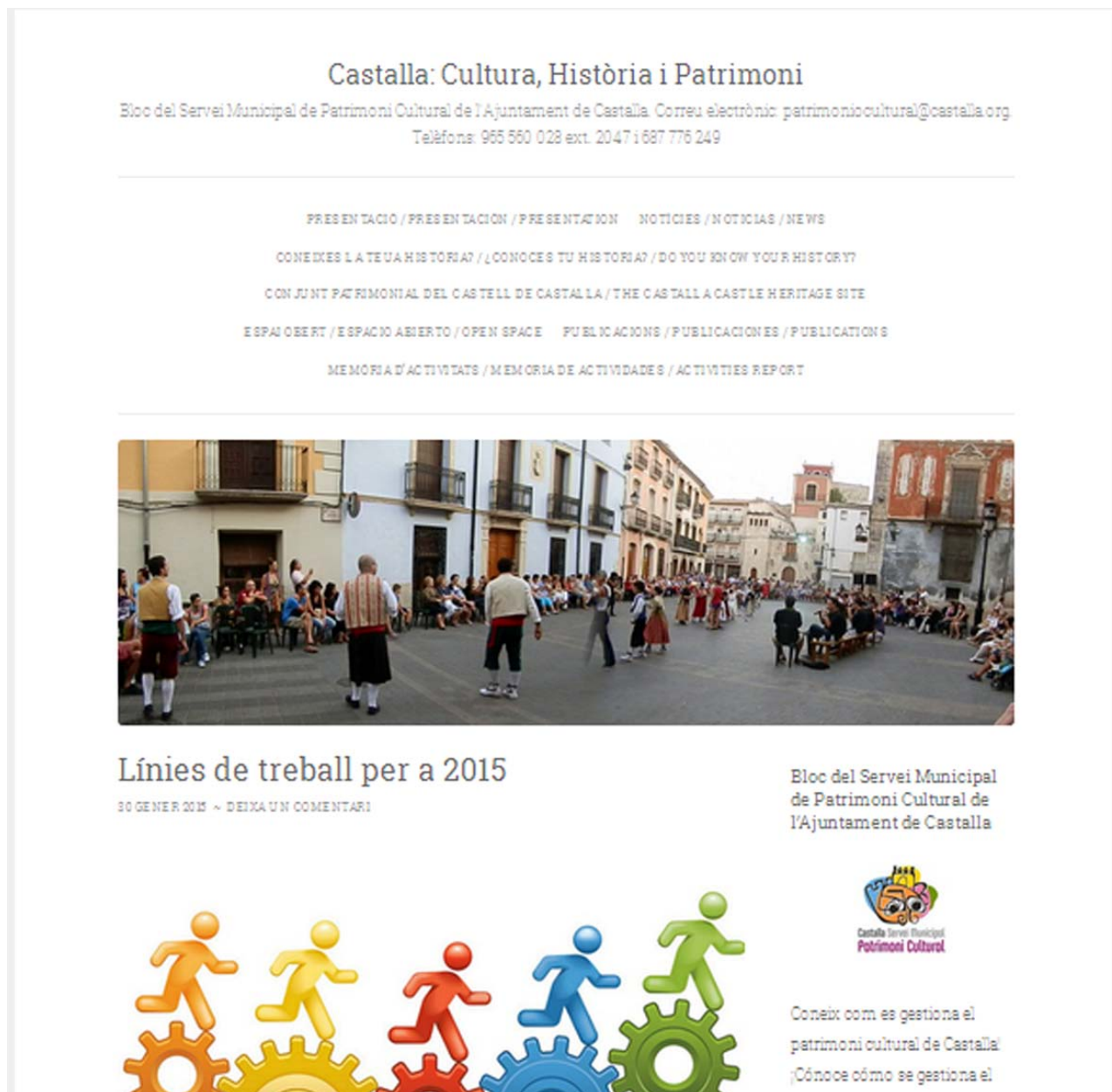
Làmina 21. Bloc Castalla, Cultura, Història i Patrimoni del SMPC.