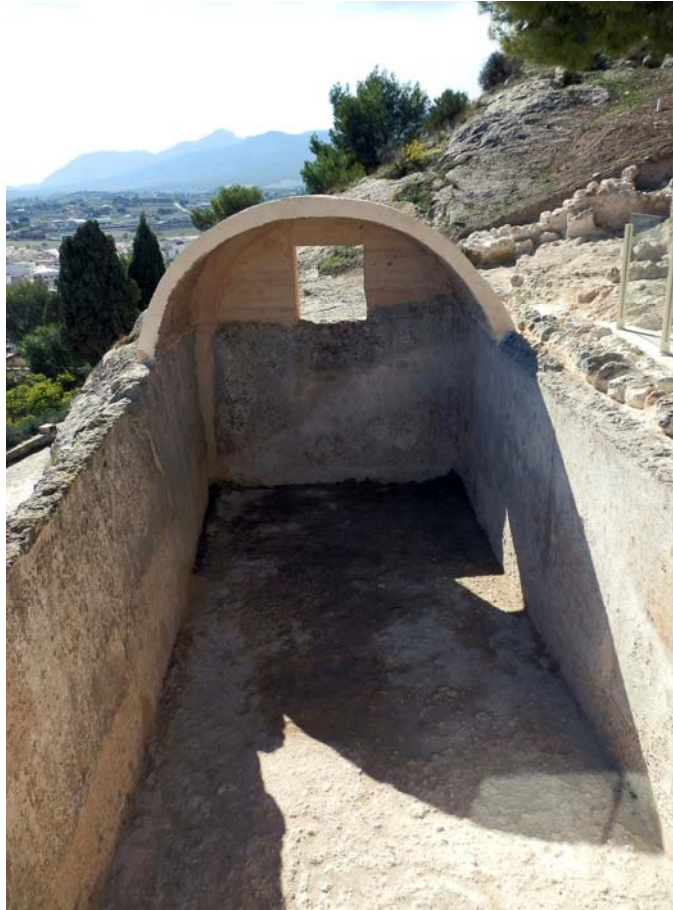
Làmines 13 i 14. Aljub sense i amb volta.