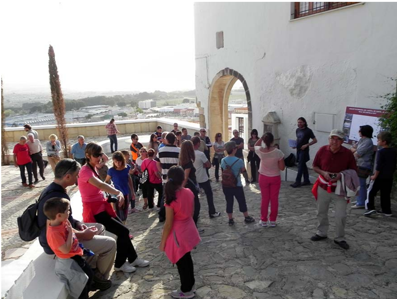
Làmina 26. Jornada de portes obertes al Conjunt Patrimonial del Castell de Castalla.

Castell de Castalla ; es van donar a conèixer els resultats del treball realitzat a la vila medieval de Castalla. A més, amb la col·laboració del personal de la Tourist Info Castalla , els visitants que ho van desitjar també van vore el Castell de Castalla.