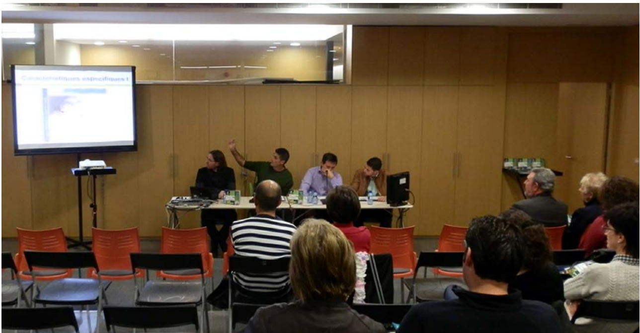
Làmina 29. Acte de presentació de la guia de visita El Conjunt Patrimonial del Castell de Castalla. Una porta oberta cap al patrimoni natural. Guia de visita de fauna i flora .