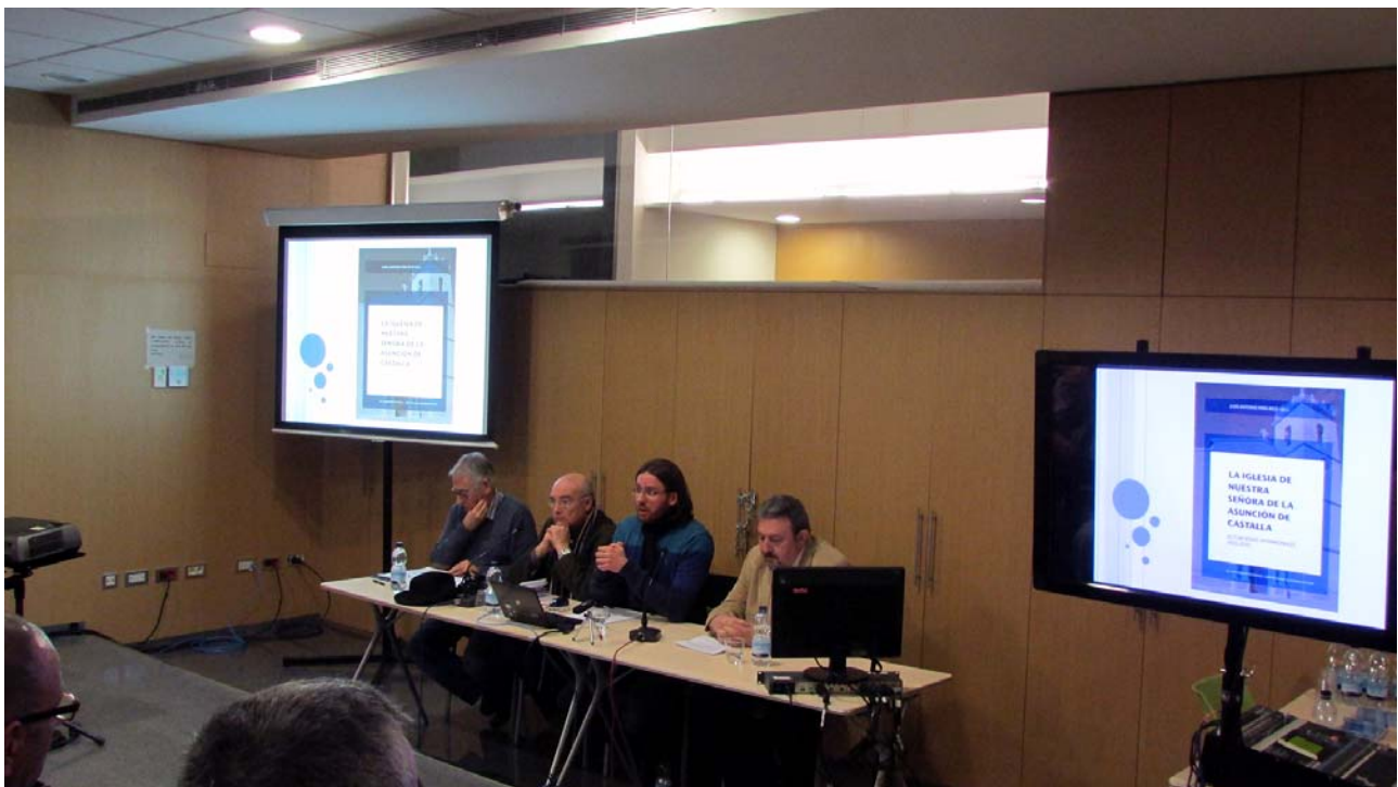
Làmina 28. Acte de presentació del llibre La Iglesia de Nuestra Señora de la Asunción de Castalla. Actuaciones patrimoniales 2005-2010 .