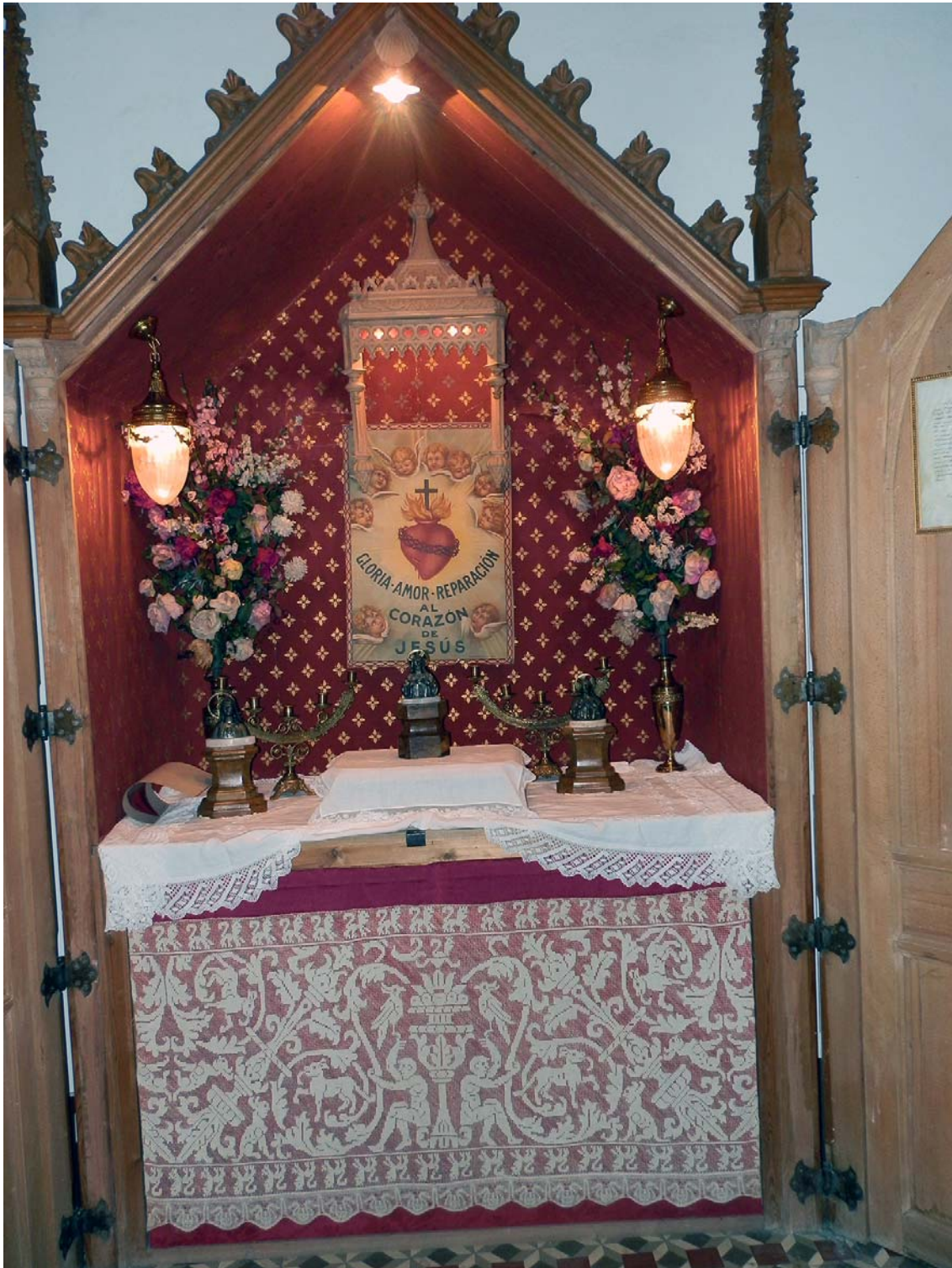
Làmina 27. Capella situada a la casa Torró.