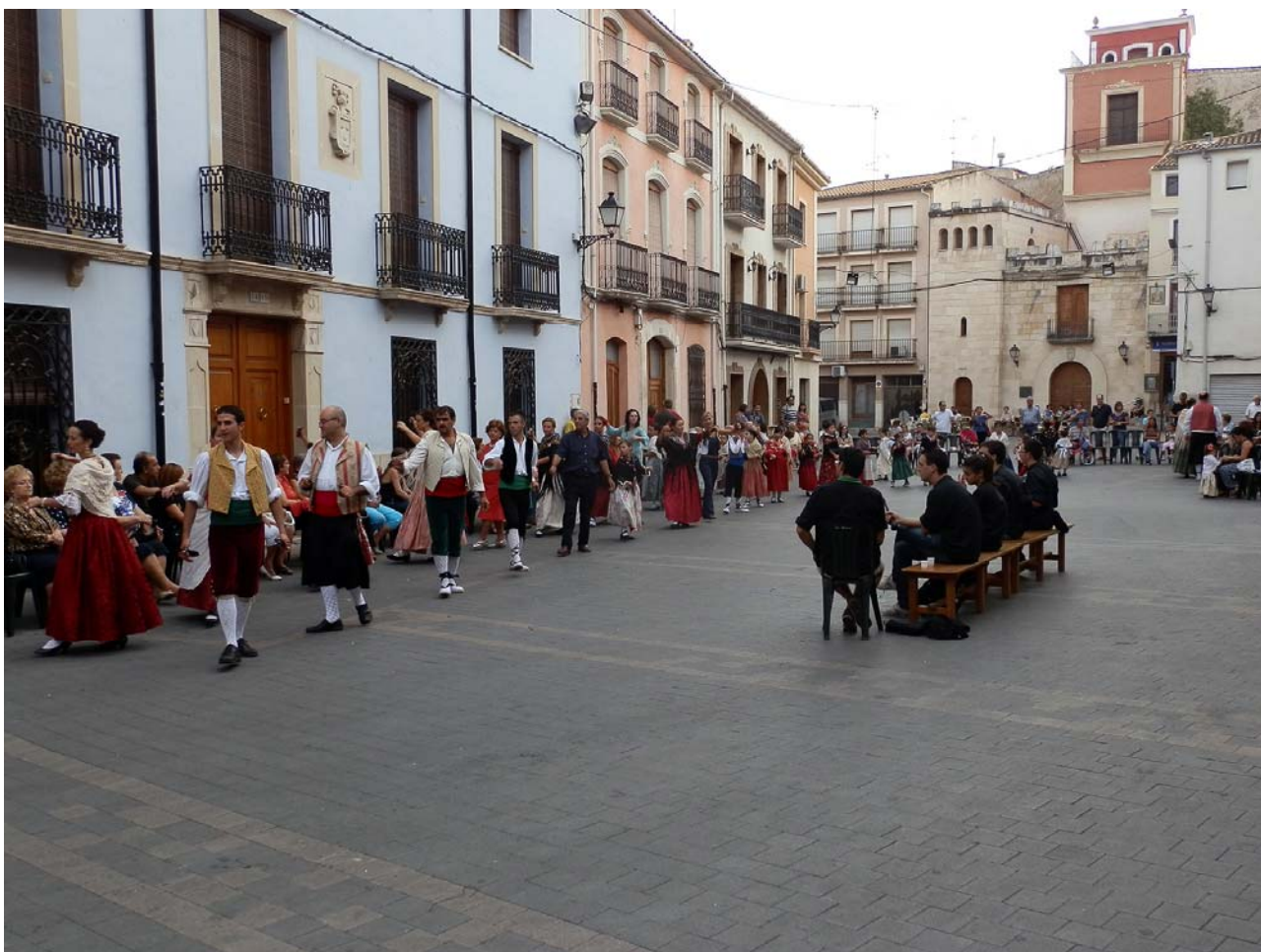
Làmina 5. Dansa de Castalla (2011).