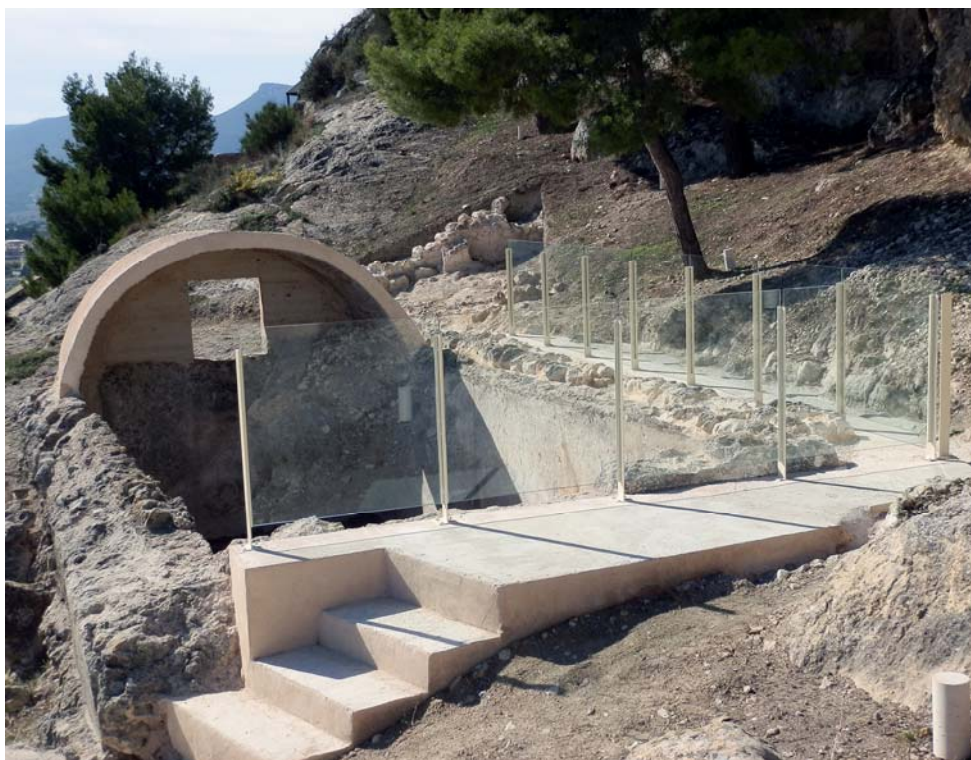
Làmina 17. Aljub en l'actualitat.

La intervenció executada ha servit, en definitiva, per a recuperar l'aljub i integrar-lo dins del recorregut visitable del Conjunt Patrimonial del Castell de Castalla (làm. 17).