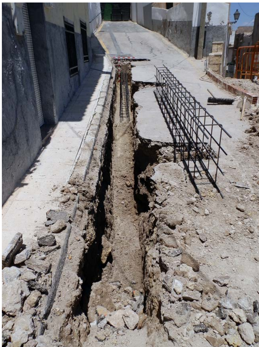
Làmina 6. Seguiment arqueològic als carrers Carril de la Sang i Trinquet.