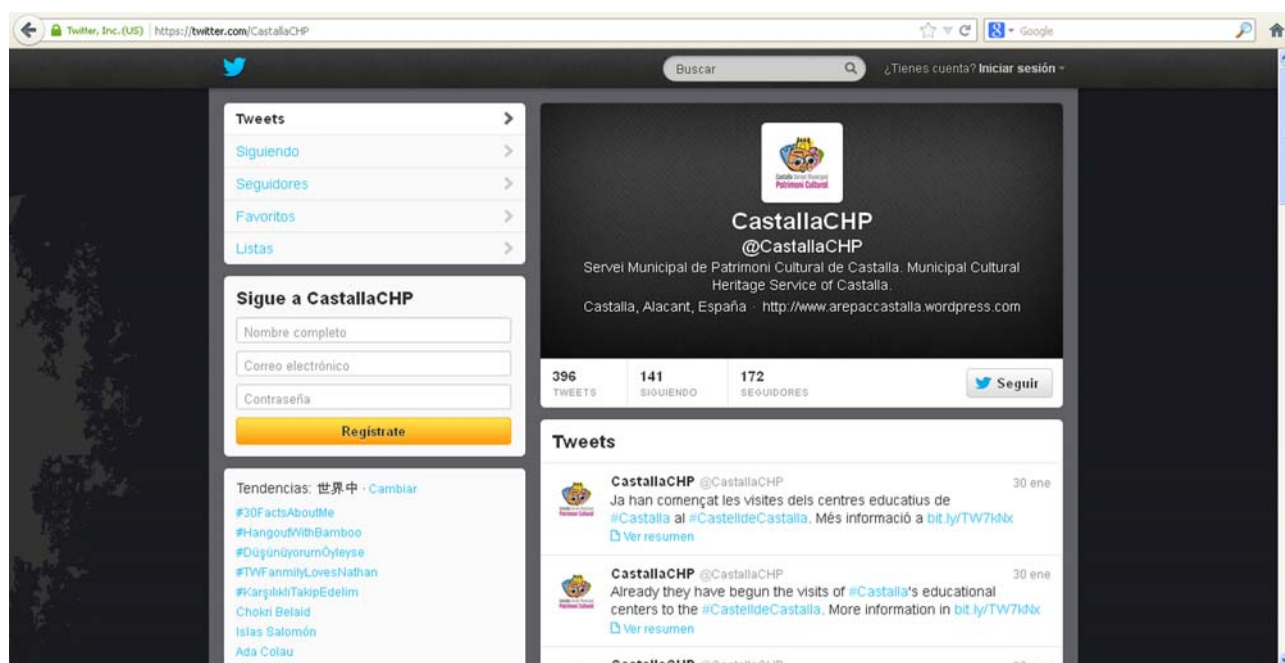
Làmina 22. Vista del perfil de Twitter del SMPC.

moments, el SMPC té en aquesta xarxa social 265 seguidors i seguidors (33 més que l'any 2013).