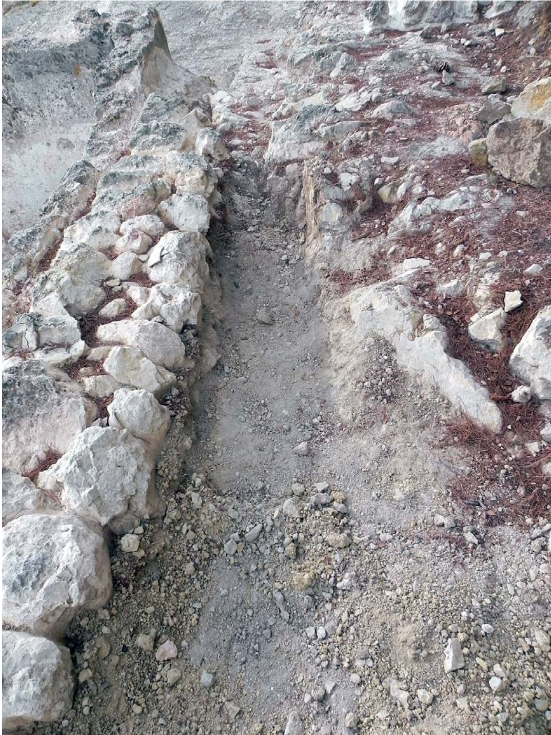
Làmina 10. Zona on es va realitzar el seguiment arqueològic.

No s'ha localitzat cap resta constructiva, ni tampoc canalitzacions d'aigua excavades sobre el terreny natural. En canvi s'han trobat 31 fragments ceràmics que pertanyen a l'època romana i l'edat mitjana (làms. 11 i 12).