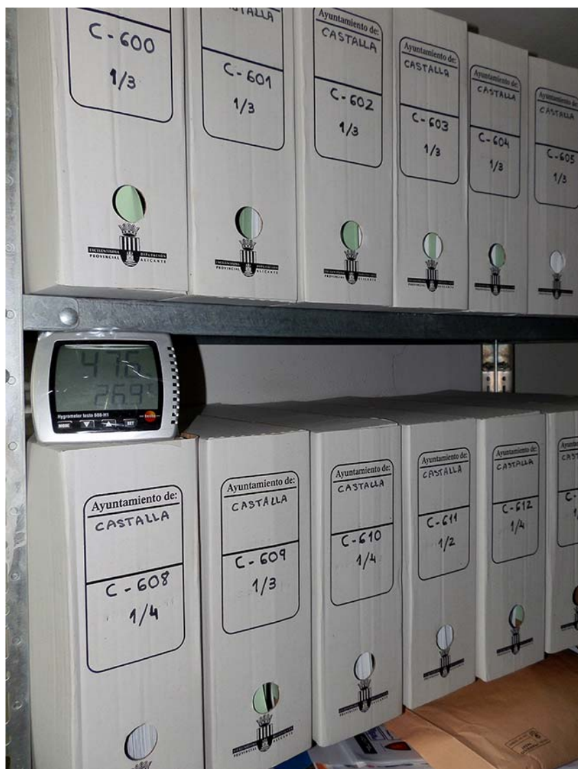
Làmina 4. Termohigròmetre instal·lat a la secció de l'Arxiu Municipal de Castalla situat a l'edifici de l'Ajuntament.

Junt amb aquesta actuació s'ha continuat amb els mesuraments setmanals de la temperatura i la humitat, mesuraments que, des de juliol de 2013, també es realitzen a la sala d'arxiu que es troba al propi edifici de l'Ajuntament, amb la instal·lació d'un controlador de temperatura i humitat (làm. 4). Els resultats dels mateixos són els següents (figs. 1-20):