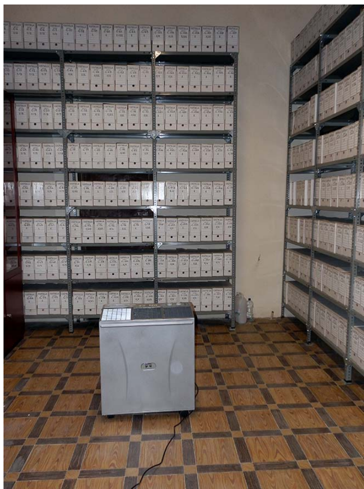
Làmina 1. Humidificador instal·lat a la secció història de l'Arxiu Municipal situat a la casa de la família Rico.