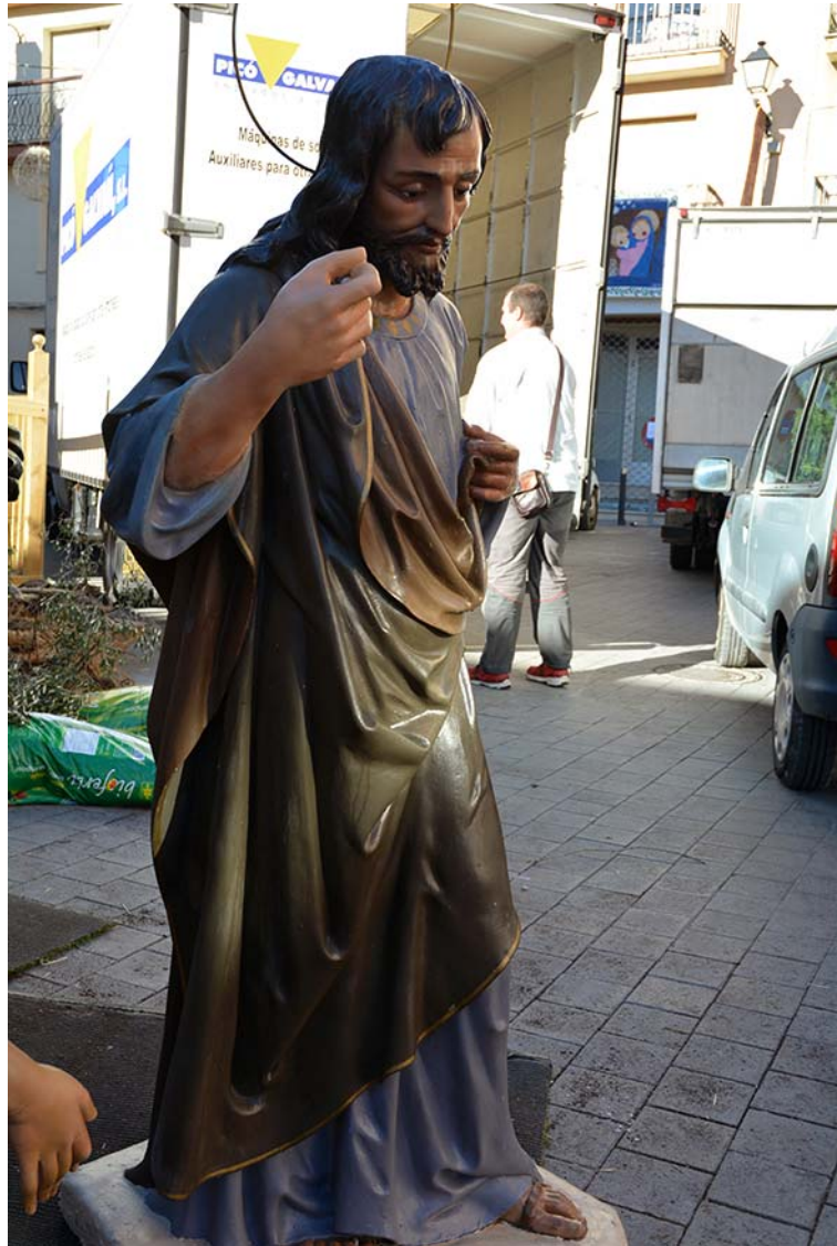
Làmines 18 i 19. Restauració de les figures del Betlem municipal.