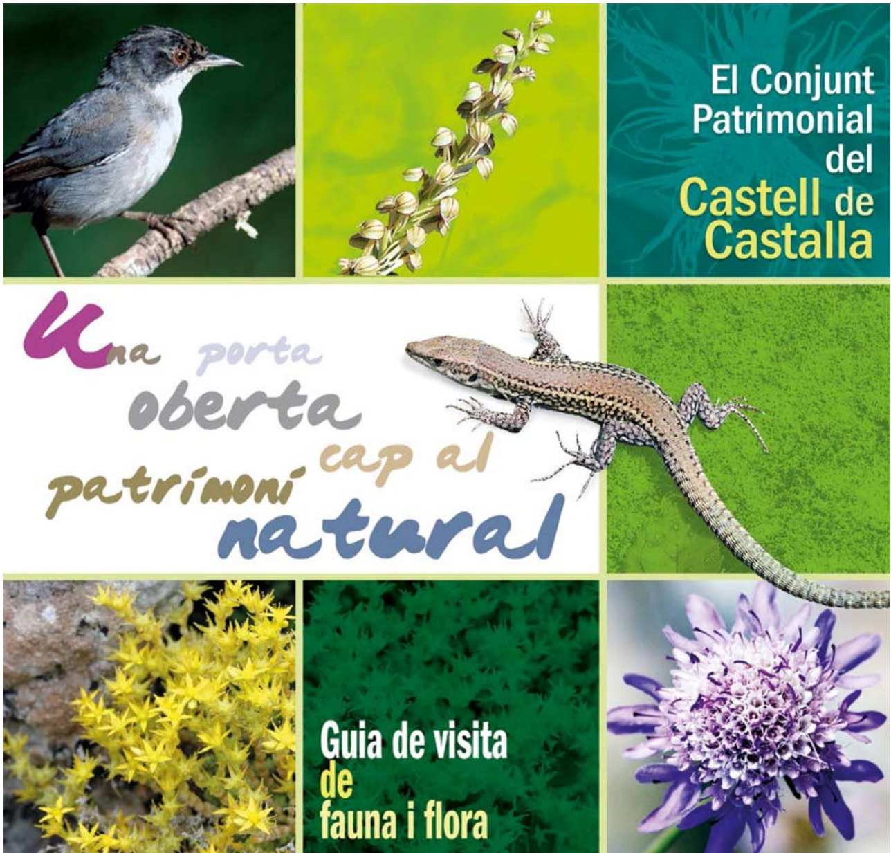
Làmina 24. Portada de la guia de visita de fauna i flora del Conjunt Patrimonial del Castell de Castalla.