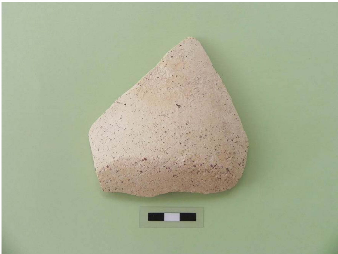
Làmina 12. Fragment de ceràmica medieval. Pitxer (segles XII i XIII).