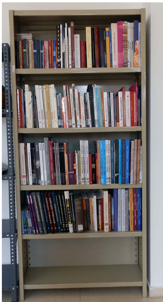
Làmina 25. Biblioteca del Servei Municipal de Patrimoni Cultural de Castalla en l'actualitat.