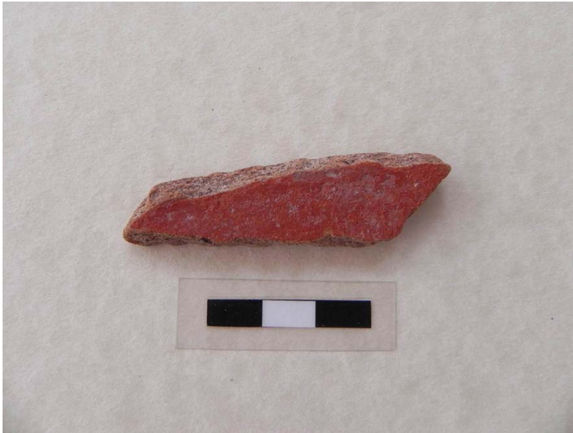
Làmina 11. Fragment de ceràmica romana. Plat procedent de la península itàlica (segle I aC).