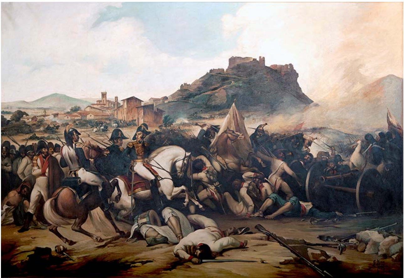
Làmina 20. Primera batalla de Castalla (21 de julio de 1812). Ajuntament de Castalla.

del Combat de Castalla, 21 de juillet 1812 , obra de Jean Charles Langlois (ca. 1836) i el qual es troba al museu del Castell de Versalles (París, França).