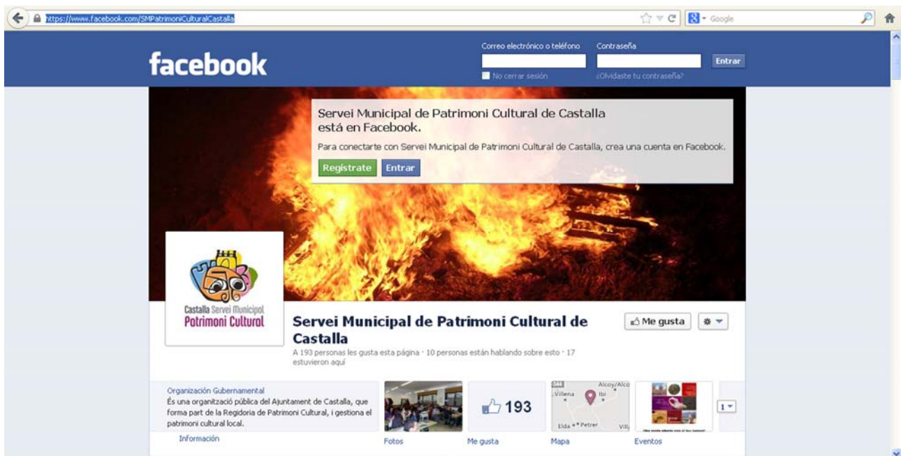
Làmina 23. Vista del perfil de Facebook del SMPC.